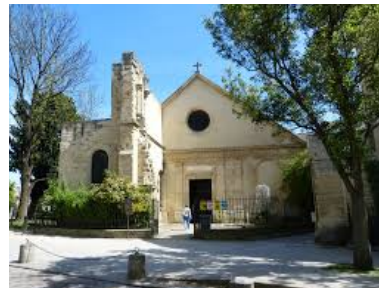
Eglise Saint Julien le Pauvre à deux pas de ND de Paris. Eglise de la communauté Melkite de la capitale.

L'Ordre Patriarcal de la Sainte Croix de Jérusalem est un Ordre de chevalerie dont le Patriarche Melkite est le Grand Maître. Cette institution aide moralement et financièrement les chrétiens de la Terre-Sainte et de tout l'Orient et notamment l'Eglise Melkite Catholique.